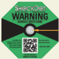
对ShockDot的正面冲击没有回应